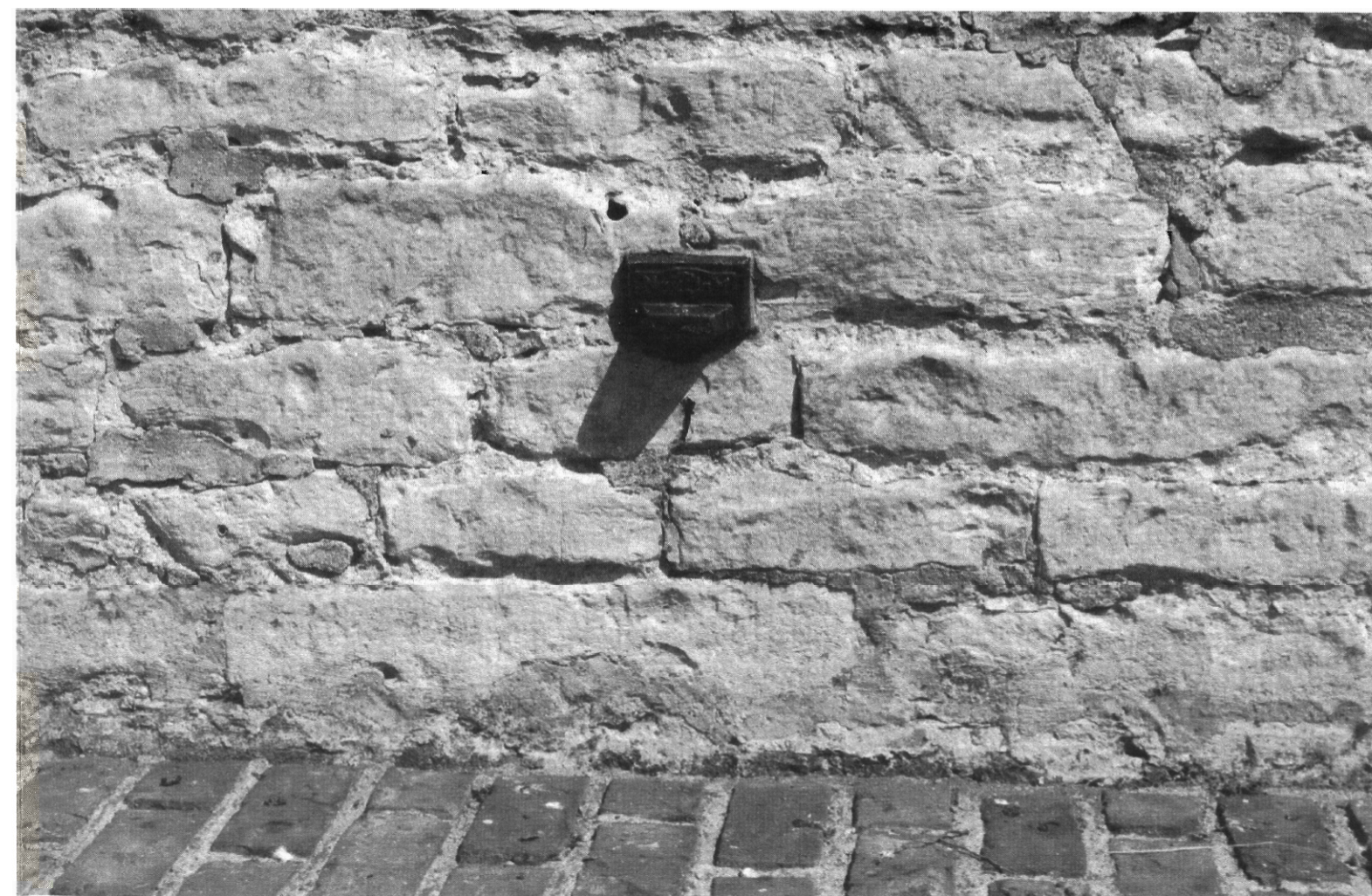
Onderaan de toren van ons klein kerkje