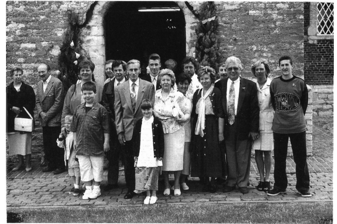
Na de misviering even poseren voor de familiefoto aan de kerkdeur

Zoals reeds gezegd werd vanaf 1946 begonnen met een meer nauwkeurige waterpassing. De merktekens uit vorige eeuw waren voor een gedeelte verdwenen en anderzijds lieten moderne meettechnieken toe om met een grotere nauwkeurigheid de hoogten vast te stellen. Het aanbrengen van merktekens gebeurde niet meer in hoofdzaak aan herbergen doch veelal aan kerken. De "Boere Tang" was trouwens als herberg op Millegem verdwenen en zowel de Pancratius- als Millegemkerk kregen rechts naast de inkomdeur een TWA merk in gietijzer . Ook aan het huis op Millegem op de hoek van de Profeetstraat (nr. 62) en St.-Antoniusstraat werd zulk merk aangebracht met stamnummer Bc 10.