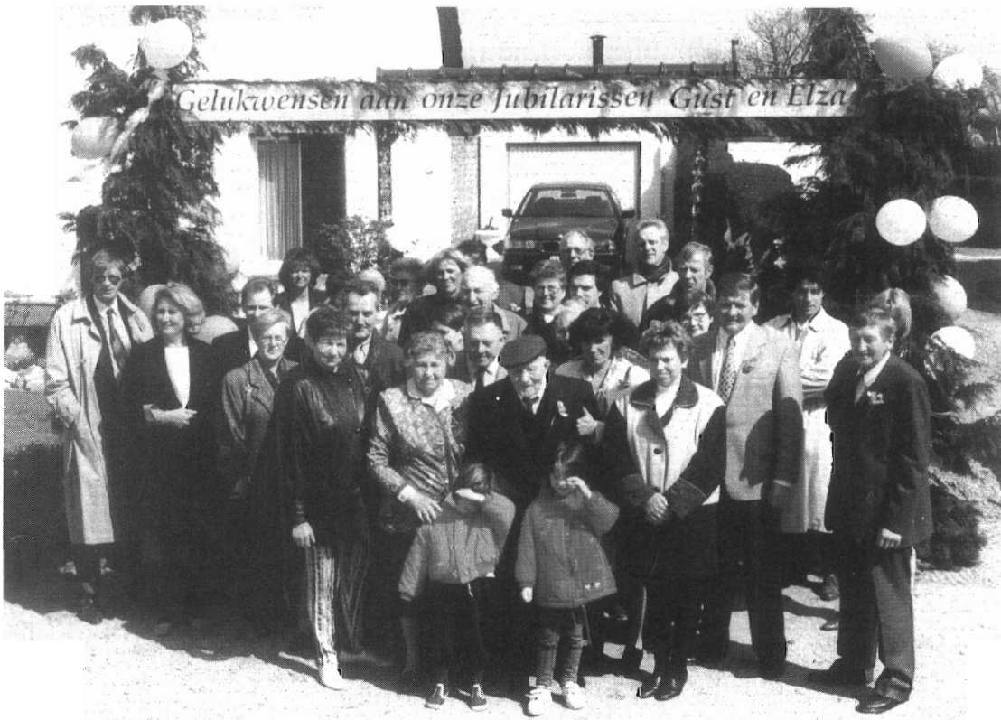
Jubilarissen, familie en buren verzameld voor de groepsfoto.