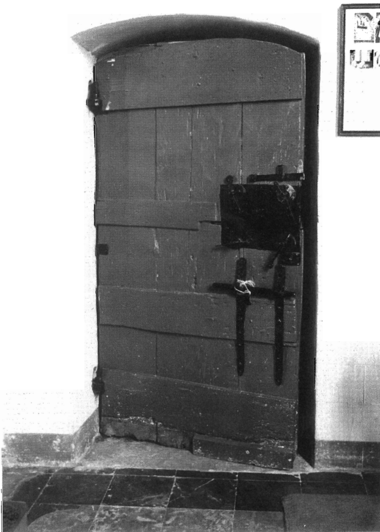
De deur met de grote sleutel.

De volgende deur in de rij is de sacristiedeur . Deze kreeg reeds de eer van het titelblad in De Millegemvriend van april 1992, met een tekening die Jan Wouters in 1931 van haar maakte en waarop toen nog het trapje te zien is dat naar de toenmalige preekstoel leidde. Deze deur, hoewel voorzien van zware hengsels en sloten, staat meestal open om een beetje verluchting in de sacristie te brengen. De meeste kerkgangers zien ze daarom niet, maar ga gerust voor of na de mis maar eens tot op het koor om haar te bewonderen, een pracht van een deur is dat !