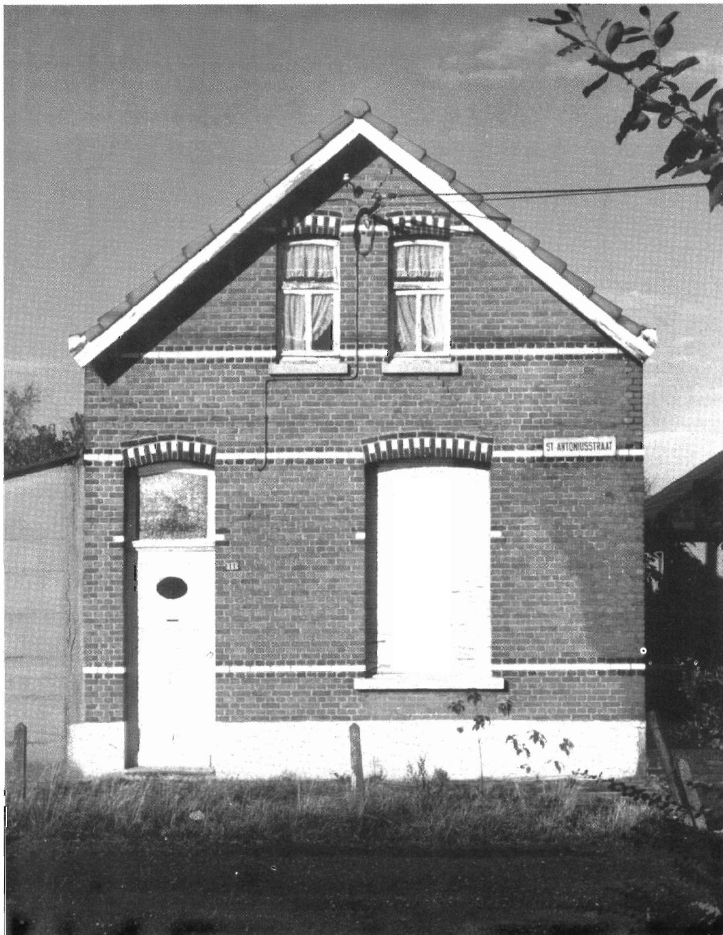
Het "punthuizeken" in de Sint-Antoniussstraat.

Verantw. uitgever: F.Schelfhout, Herentalsebaan 85, 2520 RANST, tel. 03/353.17.70. Bankrekening MILLEGEMVRIENDEN-Ranst: 733-1311310-94