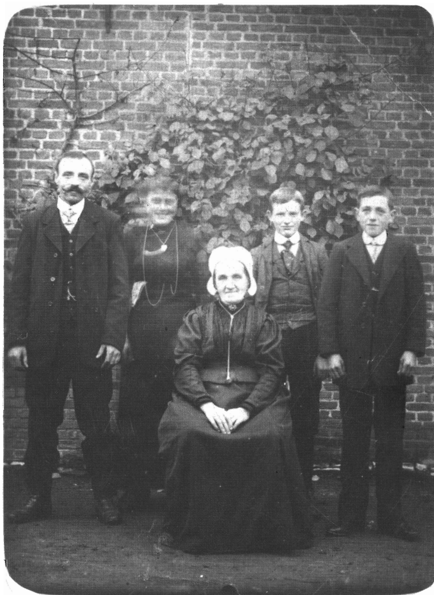
Familiefoto vóór 1930 aan de hoeve Baetens :