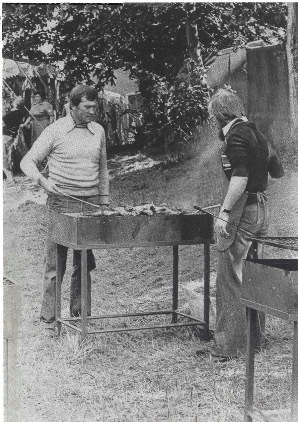
Kippen braden voor het kerkje van Millegem.

Verantw. uitgever: F.Schelfhout, Herentalsebaan 85, 2520 RANST, tel. 03/353.17.70. Bankrekening MILLEGEMVRIENDEN-Ranst: 733-1311310-94