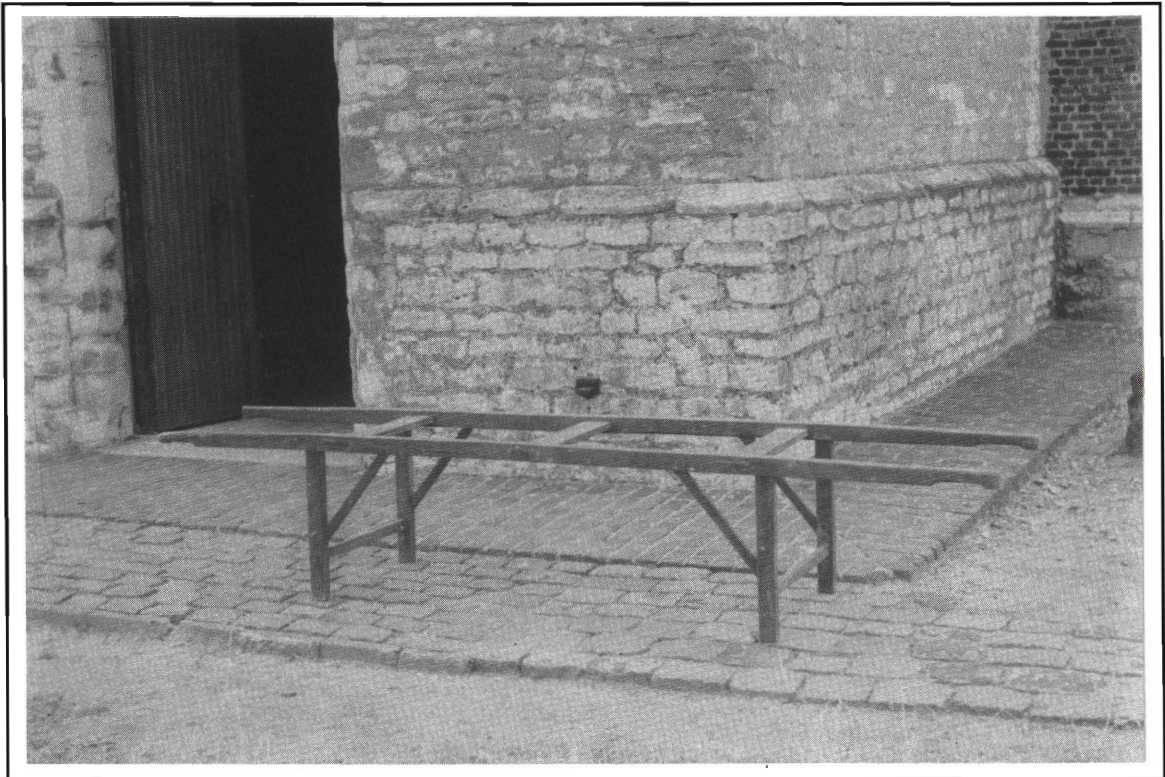
Draagbaar die te Millegem bij de begrafenissen werd gebruikt.