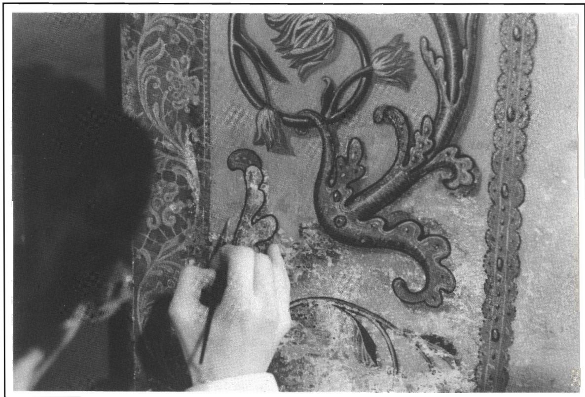
De grove borstel komt hier niet aan te pas.