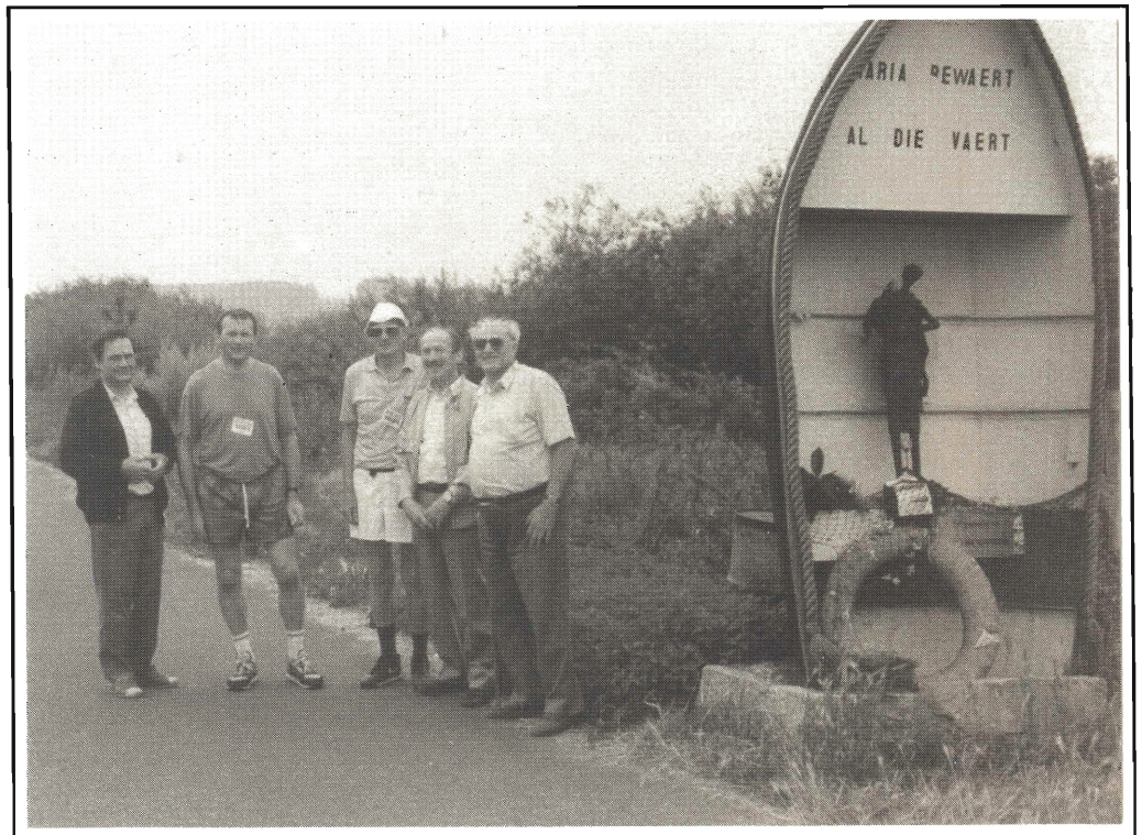
Nog 5 kilometer.