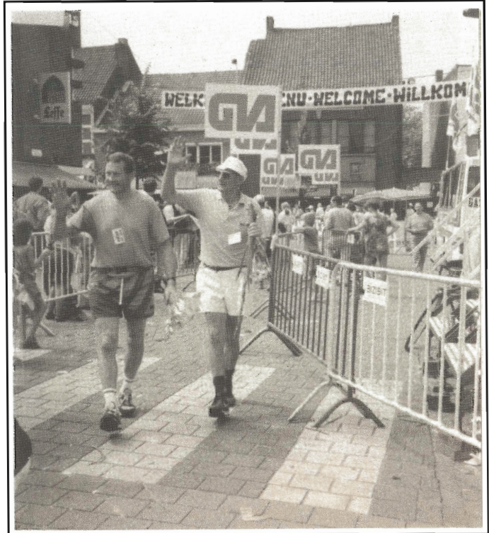
Met bloemen over de eindmeet.