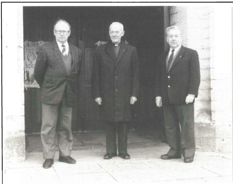
Drie generaties Pastoors van Ranst poseren speciaal voor "De Millegemvriend" :