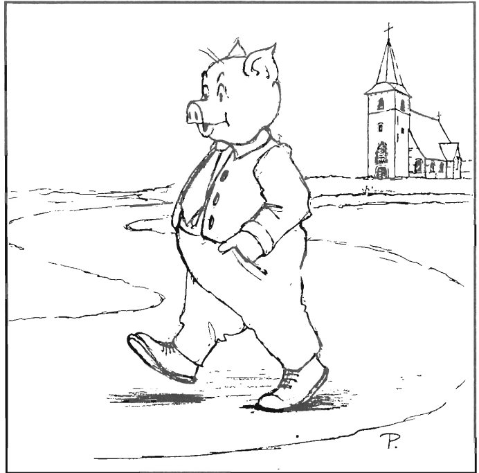
Tevreden gaat hij met zijn varkenskop naar huis... tot volgend jaar Sint-Antonius !

Er moet natuurlijk minstens één persoon zijn die een varkenskop offert en meerdere mensen mogen met een varkenskop naar het kerkje komen. En die zelf geen brood meer bakt mag dat natuurlijk ook bij de bakker gaan kopen. Daarenboven is alles wat met een goed hart geofferd wordt zeer welkom.