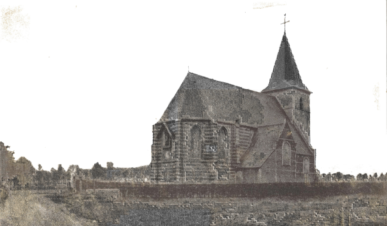
Ranst Kerk van O.-L. Vrouw Milleghem - Eglise Notre-Dame Milleghem

Komt er weldra, zoals vroeger, een haag rond ons kerkje ?