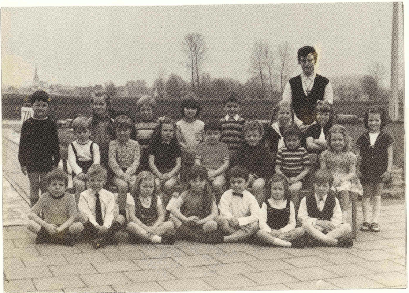
Eén van de 23 klasjes... 1971.

Wat gaat de tijd snel... zij gaat nu als kleuterleidster op rust. Drieëntwintig jaar zijn de kleuters van Millegem aan hare zorgen toevertrouwd geweest. De eerste generaties kleuters die de zuster in Millegem gekend heeft zijn ondertussen volwassen geworden. Ons blaadje is te klein om al hun namen op te sommen : Honderden. Maar vele oud-leerlingen en hun ouders zullen er zeker aan houden om de zuster bij haar op-pensioen-stelling mee te komen vieren op zaterdag 8 juli om 18 uur in onze Millegemkerk.