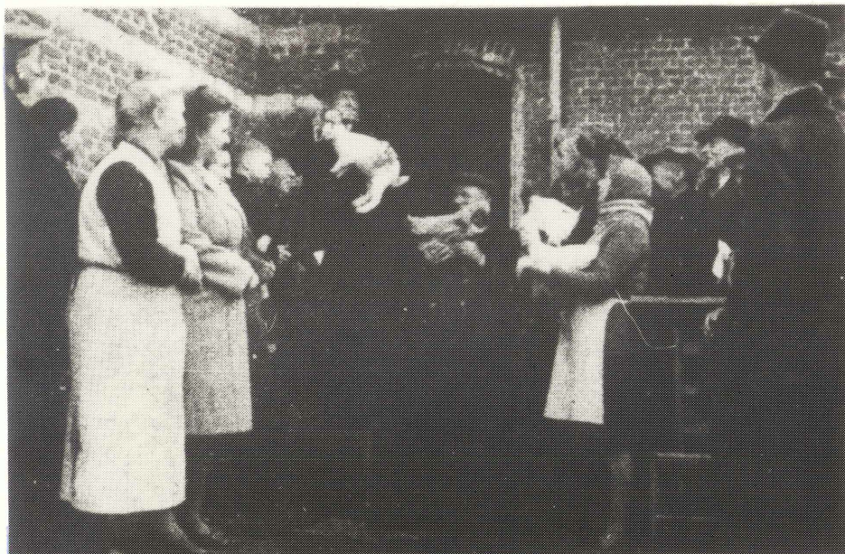
"Eén na één werden de offergaven aan de roeper overhandigd..."

De openbare verkoop gebeurde aan de zijdeur van het kerkje. Hoe koud het ook was, niemand liet zich afschrikken. Het was telkens weer een blij samentreffen van vrome heiligenverering, een vrolijk volksleven, een intiem landelijk feest aan de voet van een wondermooi kerkje.