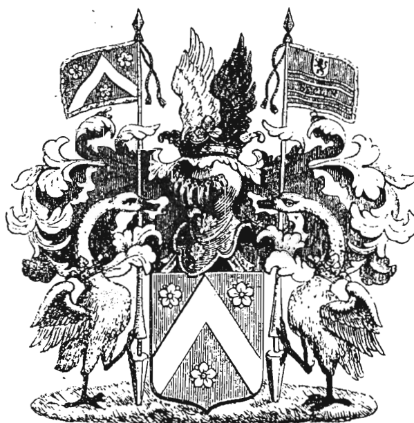
Tekening van het familiewapen ROOSE op grafsteen in de Sint Jacobskerk te Antwerpen.

Op 23 en 24 april, tussen 14 uur en 18 uur, wordt in het Technicum, Londenstraat, 43, te Antwerpen een OPENDEURDAG gehouden. Geïnteresseerden kunnen bij deze gelegenheid in de afdeling Schilderen de vordering gaan zien van de restauratie van de twee antipendia van Millegem.