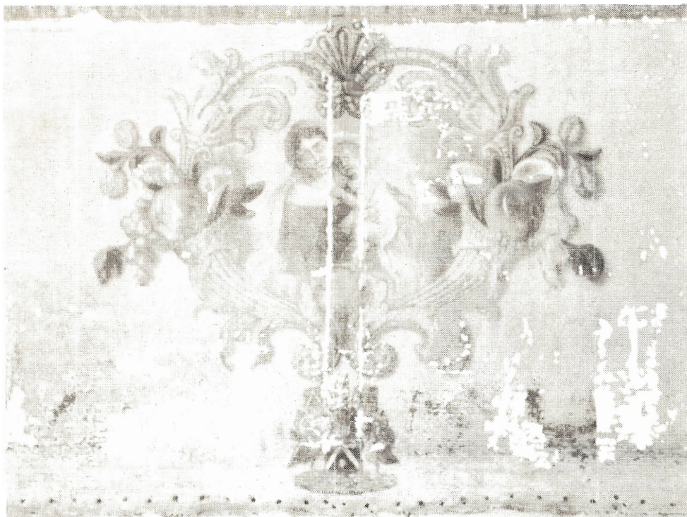
Antependium O.L.Vrouw altaar met onderaan het familiewapen ROOSE. (Foto januari 1988 - begin van de restauratie)